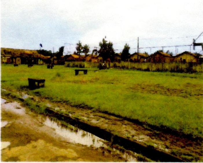
1 – FIGURA: Área de lazer do Residencial Rio Gurupi e Vale do Piriá