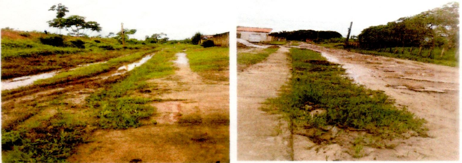
3 – FIGURA: Rua Ceará e Rua Pará no Residencial Rio Gurupi