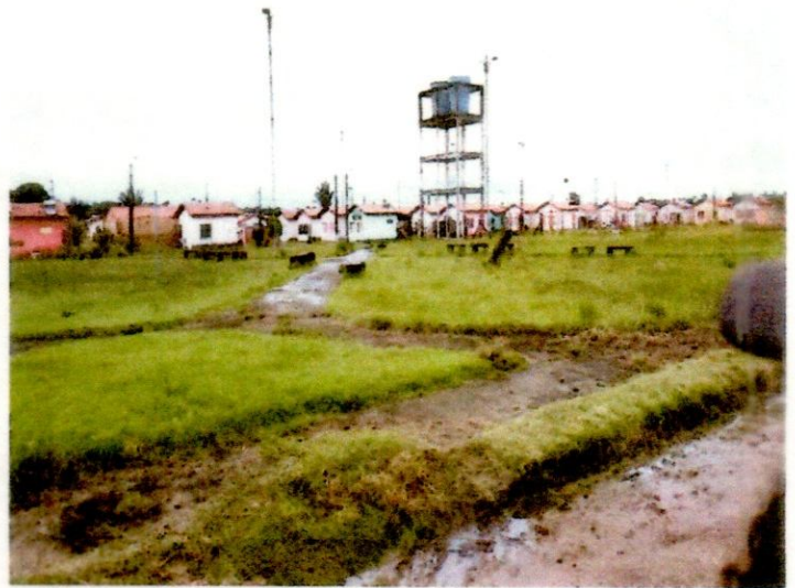
2 – FIGURA: As duas principais vias que dão acesso ao Residencial Rio Gurupi